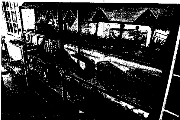
รูปแบบผลิตภัณฑ์ที่จำหน่ายที่กลุ่มเรือหัวโทงจำลอง